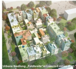
Urbane Siedlung „Feldbreite“ in Luzern-Emmen (CH)