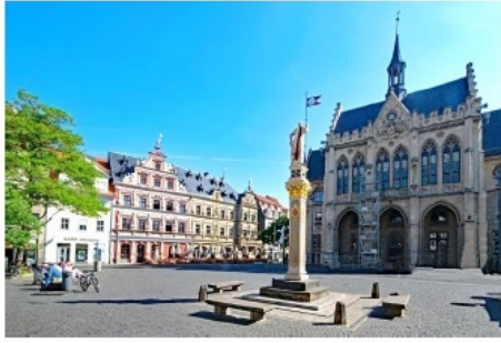
Kommunalpolitik in Thüringen - Erfahrungen und Grundlagen